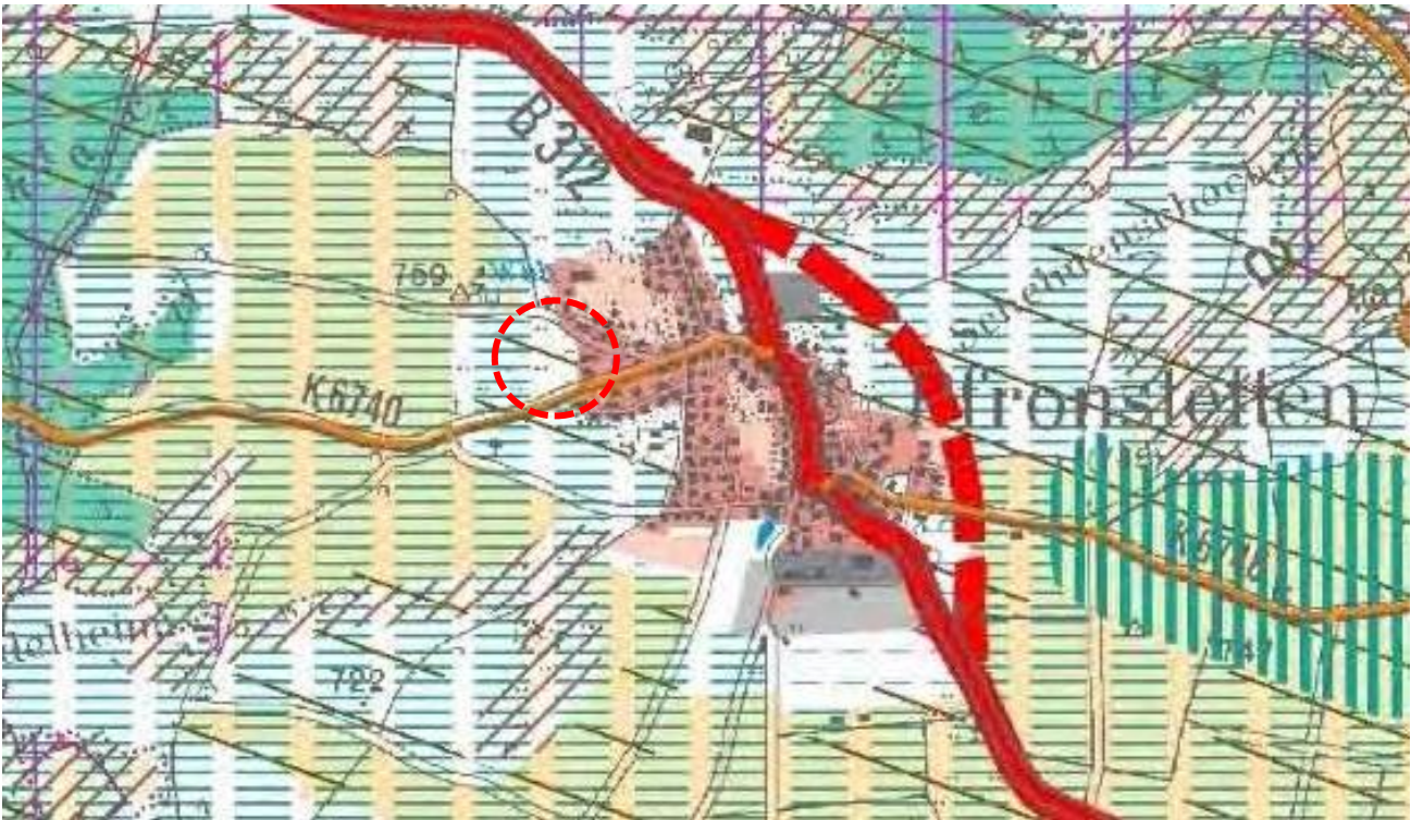
Auszug Regionalplan Neckar Alb 5. Änderung- Gewerbeflächenentwicklung