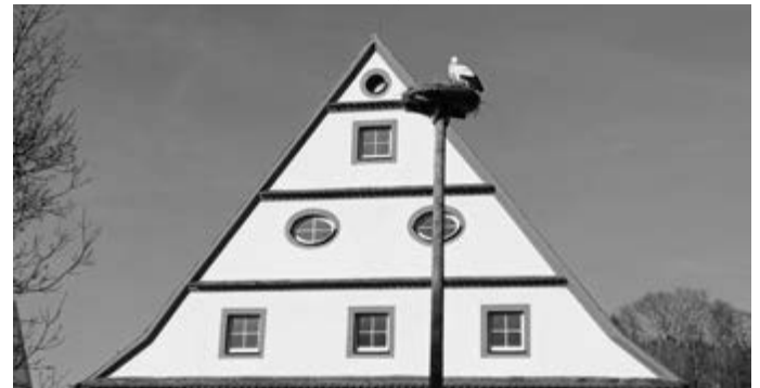
Frisch bezogener Storchhorst auf dem Klinikgelände des ZfP Südwürttemberg in Zwiefalten.

In enger Abstimmung mit dem Naturschutzbund Tübingen wurde das Nest auf dem Münster schließlich entfernt und ein neuer Horst auf dem ZfP-Gelände errichtet. Seit Anfang April klappern und brüten die ehemaligen Münsterbewohner nun in rund zehn Metern Höhe vor dem Ökonomiegebäude der Klinik.