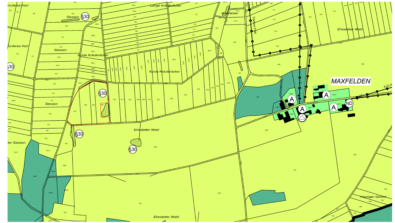
Auszug Flächennutzungsplan GVV Zwiefalten - Hayingen