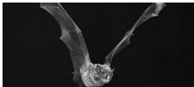
Großer Abendsegler

Da die Zahl der Plätze begrenzt ist, ist eine rechtzeitige Anmeldung notwendig. Die Platzvergabe ergeht nach Eingang der Anmeldungen, ggf. gibt es eine Warteliste. Bei Krankheit wird um eine Abmeldung gebeten, damit Wartende nachrücken können. Bei Fragen hilft das Team des Biosphärenzentrums Schwäbische Alb unter Tel. 07381 932938-31 von Dienstag bis Sonntag von 10:00 bis 18:00 Uhr gerne weiter.