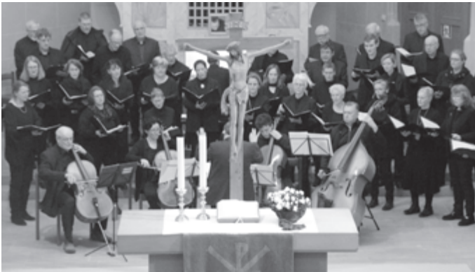
Kammerchor der Martinskirche Münsingen im Jahr 2024