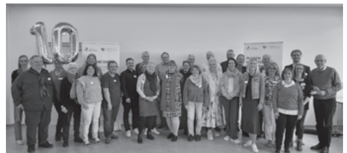
Foto: Gruppenbild vom Netzwerktreffen am 28. März 2025

Weitere Informationen zu den Gesunden Gemeinden und Städten sind unter folgender Website zu finden: www.gesundheitskonferenz-rt.de