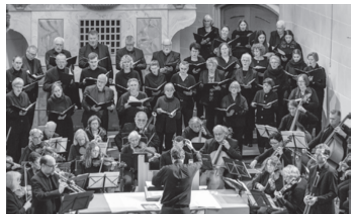
Kantorei, Kammerchor und Orchester der Martinskirche Münsingen im Herbst 2024

Restkarten (zzgl. 2 €) gibt es an der Abendkasse, die ab 18.15 Uhr geöffnet ist. Da die Veranstalter mit einer ausverkauften Vorstellung rechnen, wird empfohlen, den Vorverkauf rechtzeitig wahrzunehmen.